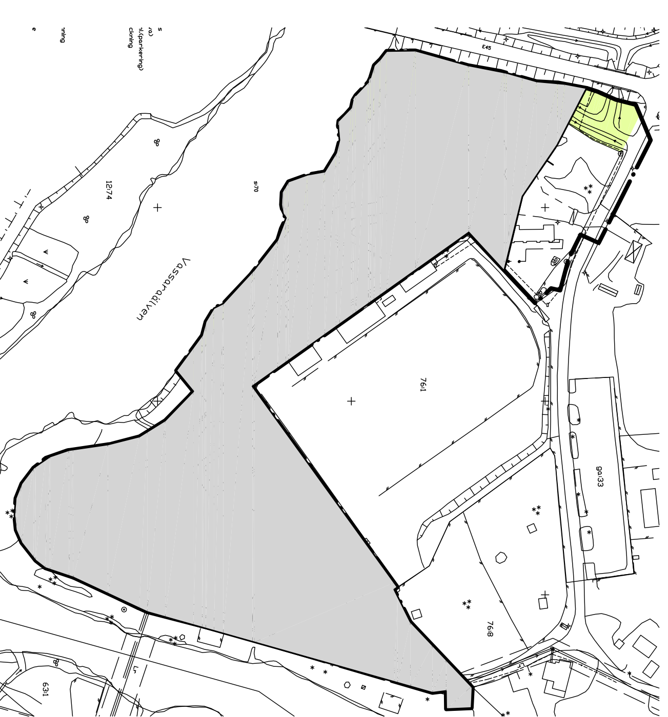
ADMINISTRATIV ILLUSTRATION strandskyddet upphävs inom grått markerat område

bruna byggnader = befintliga byggnader rosa byggnader = möjlig ny bebyggelse