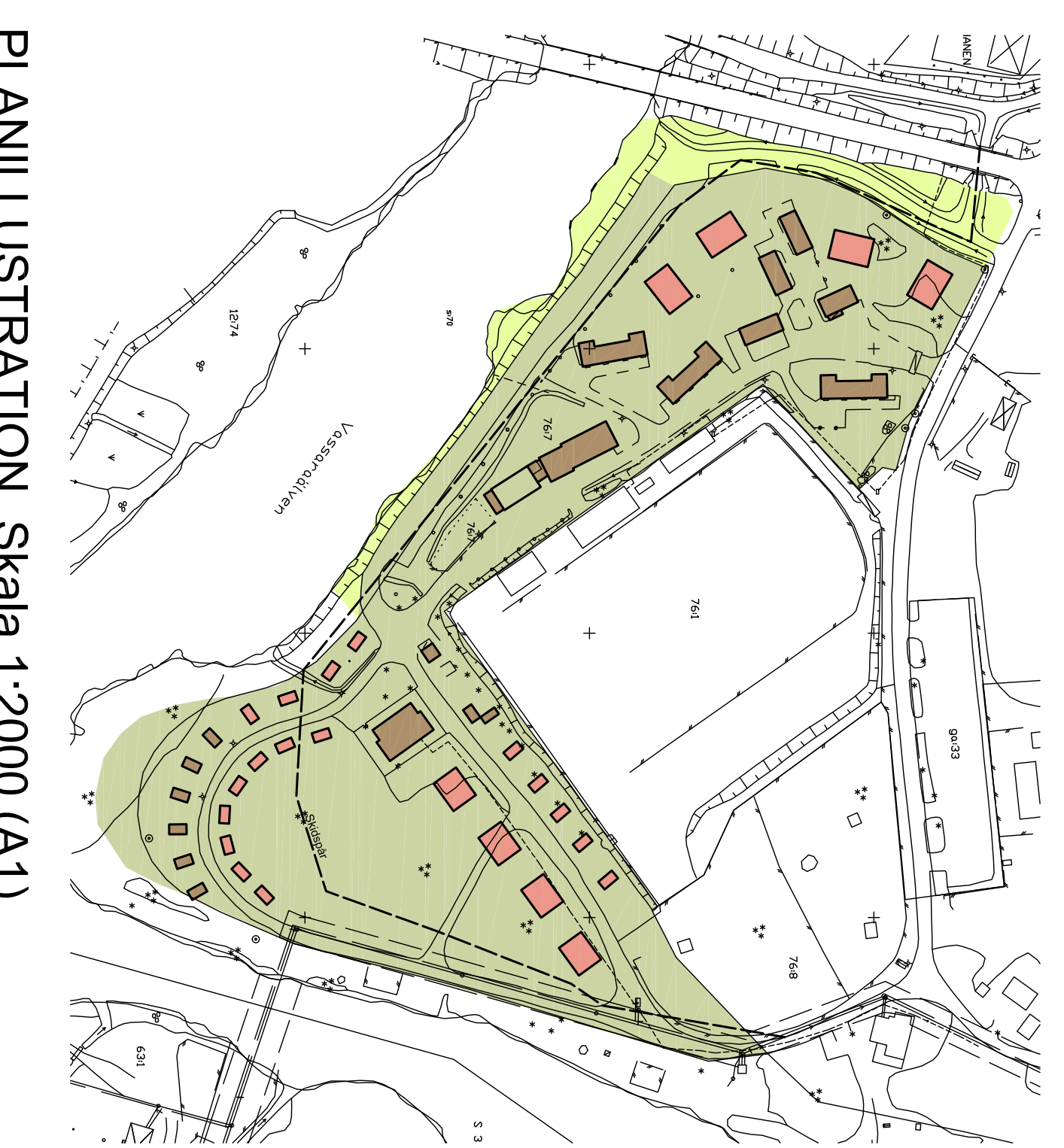
PLANILLUSTRATION Skala 1:2000 (A1)

bruna byggnader = befintliga byggnader rosa byggnader = möjlig ny bebyggelse