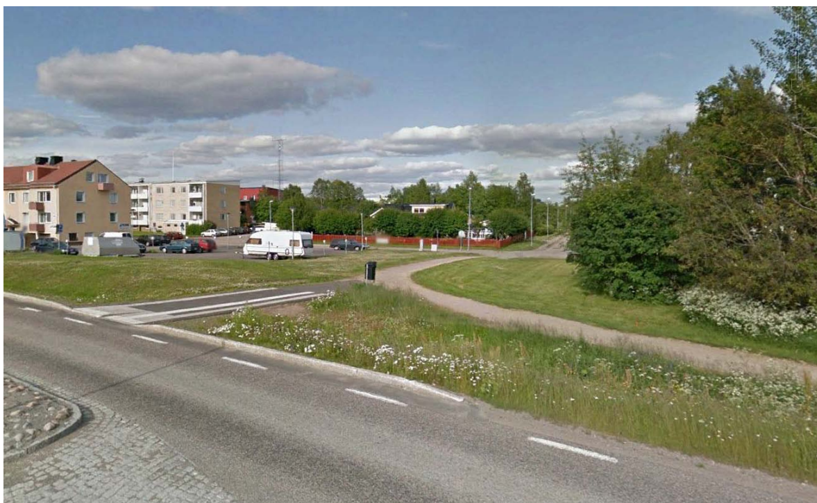
Figur 2. Planområdet sett från Parkgatan (E45) med gång- och cykelvägen i förgrunden.

Den södra delen av planområdet är idag bebyggd med ett bostadshus och tillhörande uthus. Byggnaderna ska rivas för att ge plats för det nya flerbostadshuset. Inom planområdet finns också ett litet sophus. Bebyggelsen söder och öster om planområdet består av enfamiljshus i en eller två våningar. Direkt norr om planområdet finns ett flerbostadshus i tre våningar.