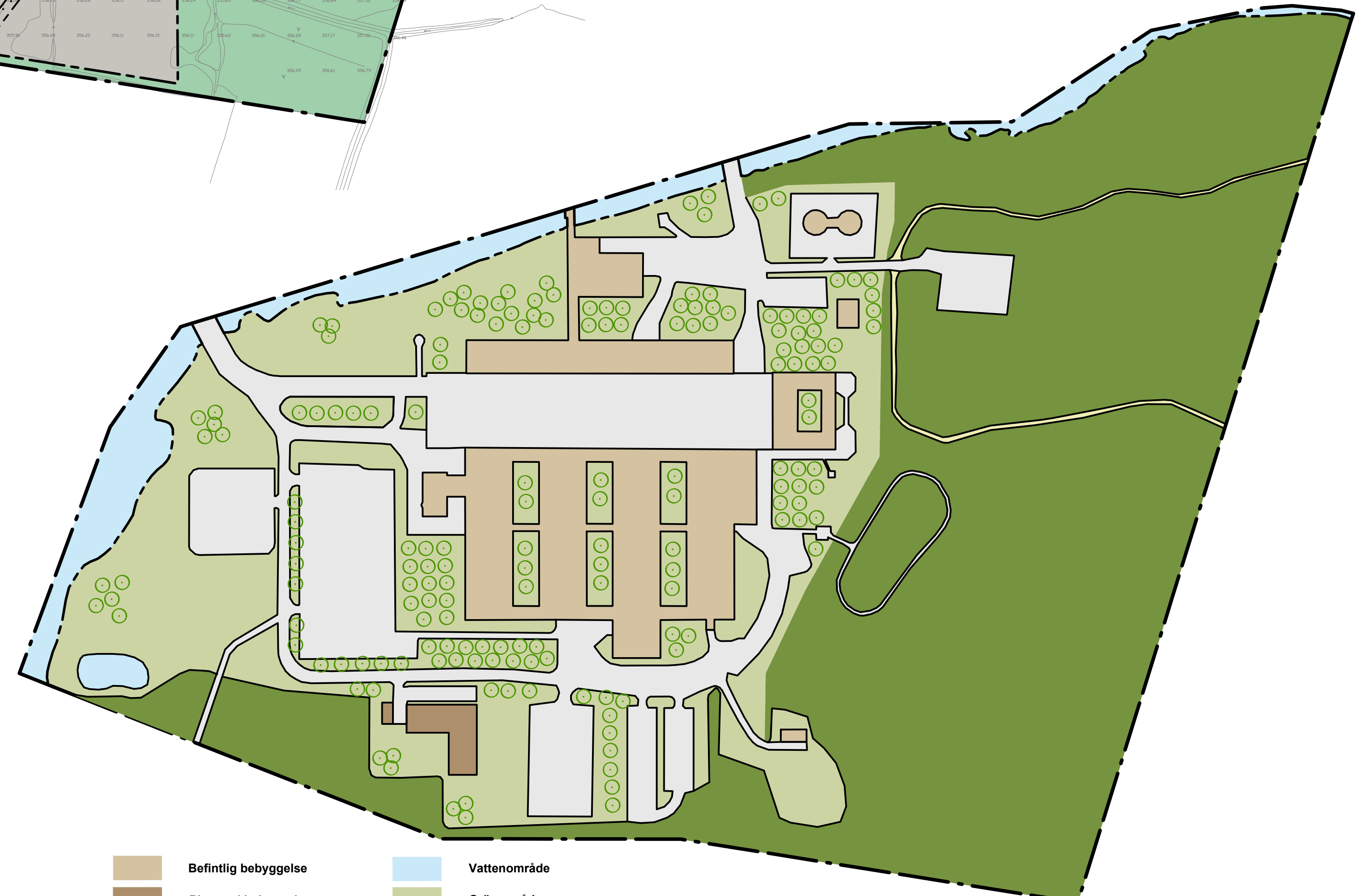
PLANILLUSTRATION Skala: 1:2000 (A1) 1:4000 (A3)