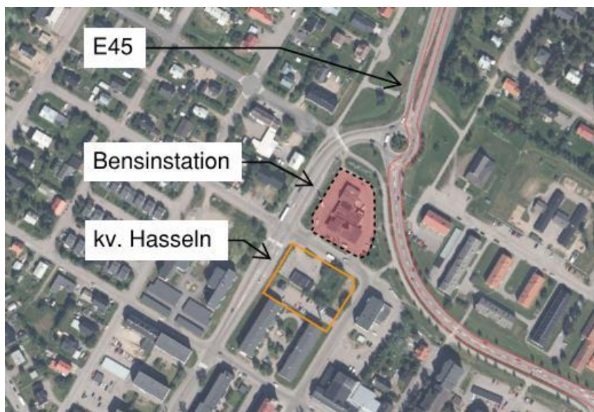
Figur 2. Positionering av bensinstation i förhållande till E45 och kvarteret Hasseln.

Minsta avstånd mellan planområdet och väg E45 är 41 meter. Minsta avstånd mellan planområdet och mätarskåp på bensinstationen är 25 meter. Skyltad hastighet på E45 förbi planområdet är 50 km/h.