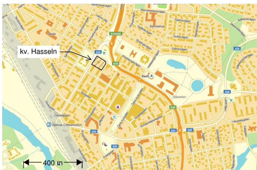
Figur 1. Kvarteret Hasselns positionering inom Gällivare kommun.

Kvarteret Hasseln ligger i centrala Gällivare, se Figur 1. Öster om Hasseln löper E45 vilken är en primärled för farligt gods. Närområdet kring kvarteret utgörs främst av bostadsområden. Kvarteret avgränsas i norr av Lappfogdevägen och på andra sidan denna väg ligger en bensinstation, se Figur 2. Det huvudsakliga syftet med detaljplanen är att skapa förutsättningar för en förtätning med flerbostadshus. Detta för att möjliggöra planmässiga förutsättningar för en del av behovet av de ersättningsbyggnader som LKAB måste upprätta på grund av gruvdriften i Malmberget. I dagsläget innefattar planen cirka 60 lägenheter i tre separata Lamellhus. Planer finns även att i byggnaderna upprätta ett parkeringsdäck (under marknivå) med cirka 110 parkeringsplatser.