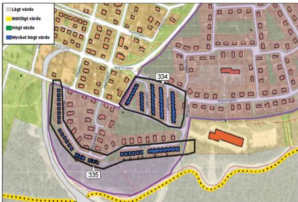
Figur 5. Urklipp ur kulturmiljöanalysen, som visar att det finns bevarandevärda objekt inom området och en värdefull kulturmiljö.

Bebyggelsen i området består av enbostadshus i form av friliggande småhus samt radhus i en eller två våningar från 1950-talets senaste del. De flesta av husen är byggda i trä, men fasader i puts och tegel förekommer också. Figur 5 (nedan) redovisar bevarandevärda objekt från området.