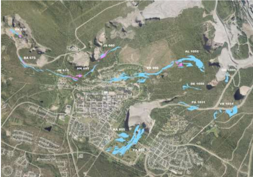
Figur 1. Malmkroppar i Malmberget samt brytningsnivå, år 2018

LKAB:s brytningsmetod, skivrasbrytning, innebär att hålrum uppstår i berget när järnmalmen bryts. Hålrummen fylls sedan av gråberg som rasar ned. Det sker alltså en automatisk igensättning och ju mer malm som bryts desto mer sjunker berget ovanför. Konsekvensen blir tillslut att markdeformationer uppstår på markytan.