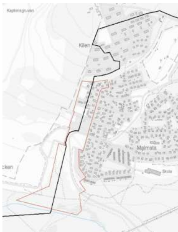
Figur 6. Bilden visar staketdragning 2019. Planområdet har markerats med röd linje. Illustration: Sweco Architects