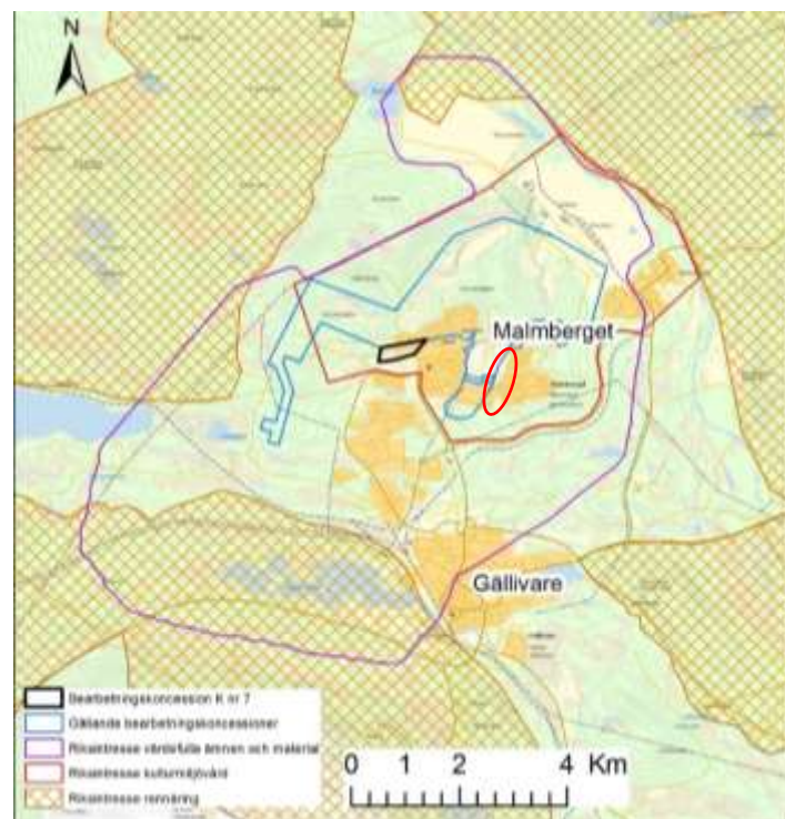
Figur 7. Planområdet är utmärkt med en röd ring. Utpekade riksintressen i Malmberget, värdefulla ämnen och material (lila linje), kulturmiljövård (röd linje) samt rennärning (bruna skraffering).

De riksintressen som finns i närheten av planområdet redovisas nedan (figur 8). Riksintressen för värdefulla ämnen och mineral samt riksintresse för kulturmiljö berörs direkt av detaljplanens genomförande.