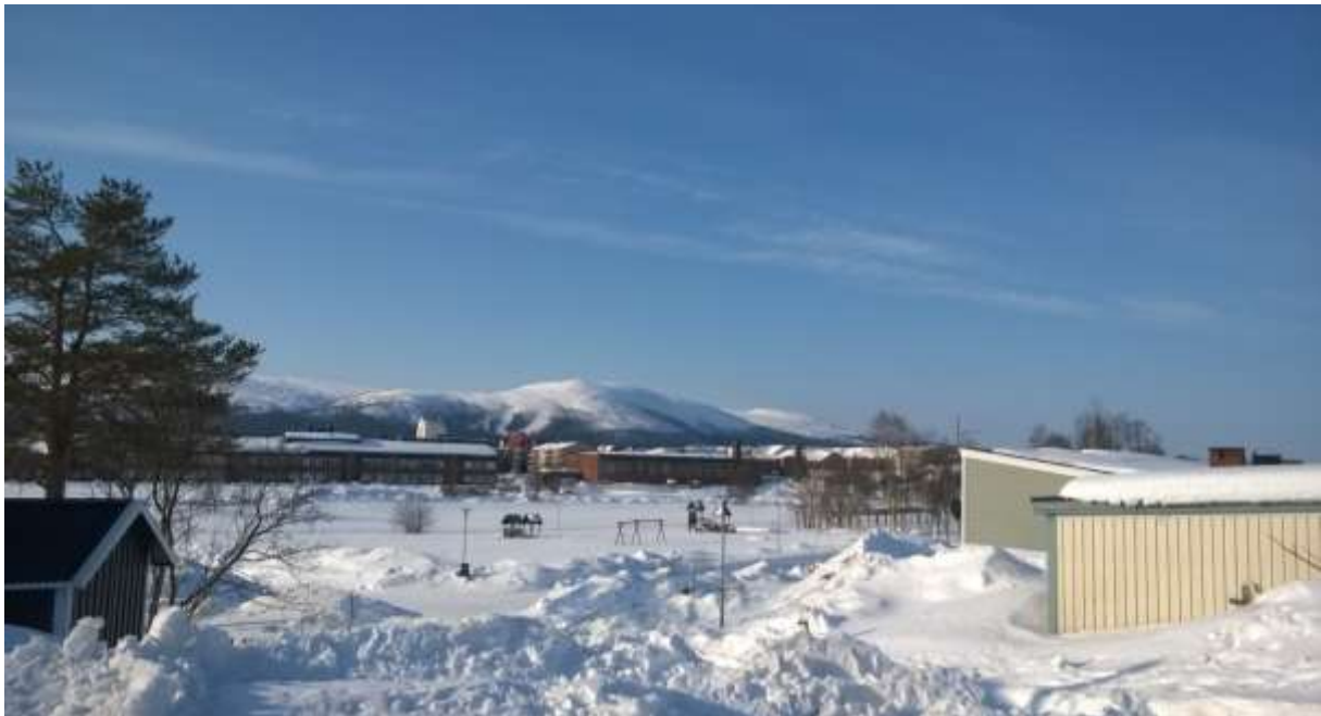
Figur 6. Dundret är idag väl synligt ifrån bostadsområdet nordöst om planområdet.

I närheten till planområdet finns Sjöparksskolan som har ungefär 70 anställda. Badhuset och gymmet har cirka 7 anställda. Dessa verksamheter använder den befintliga parkeringsytan i dagsläget. Parkeringsytan har utformats och hänsyn har tagits till verksamheternas behov av antalet parkeringsplatser. Läs mer under rubrik ”Parkering, utfarter”.