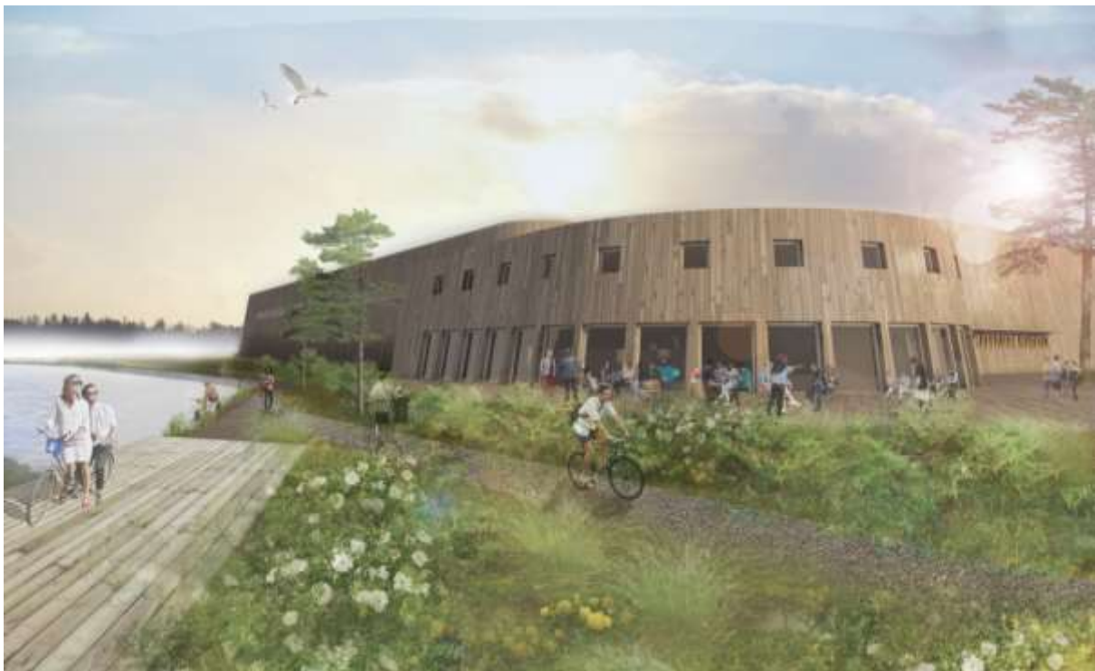
Figur 5. Illustration som visar förslag på hur en möjlig utformning av is- och evenemangsarenan kan skapa mötet med Sjöparken (MAF arkitektkontor AB).

En varierad utbredning av hårdgjorda ytor, torgyta samt närheten till parken skapar plats med möjlighet för spontan lek. Planerade lekaktiviteter inryms i byggnaden, men bör också finnas i den framtida utformningen av Sjöparken.