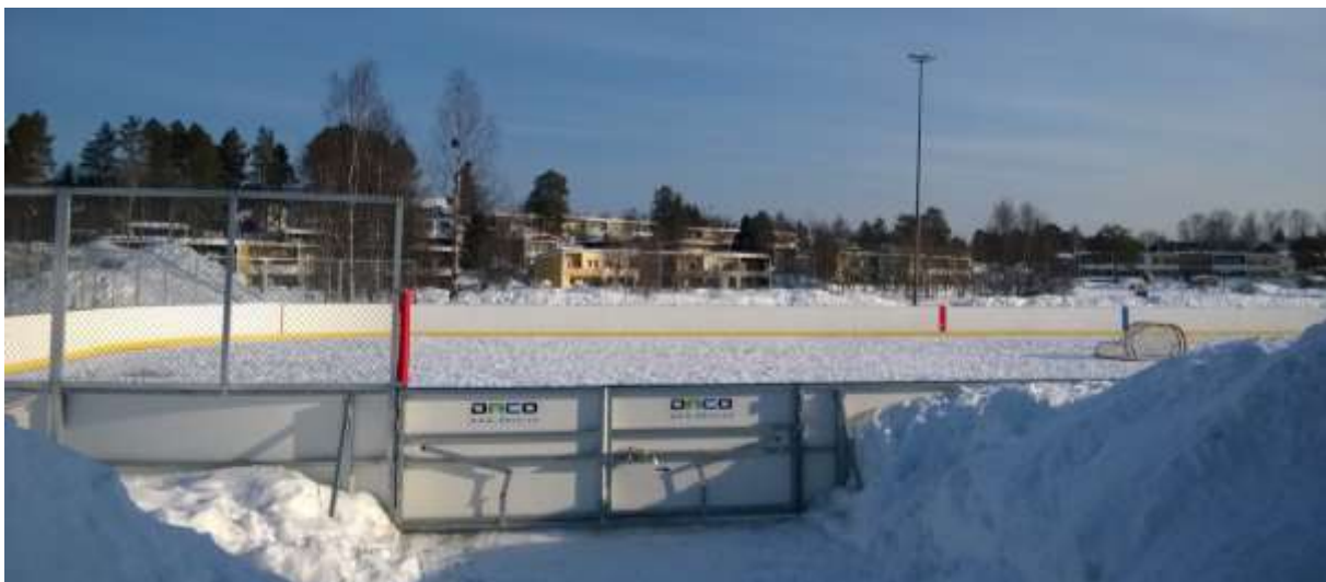
Figur 4. Ishockeyrink som fanns inom planområdet med Sjöparken och bostäder i bakgrunden.

Planområdet ligger i utkanten av Sjöparken som är en viktig mötesplats i tätorten som inrymmer möjlighet till lek och rekreation för invånarna. Kvaliteten är i dagsläget undermålig varför ett parallellt arbete pågår att se över parkens gestaltning och tydliggöra dess nödvändighet som mötesplats.