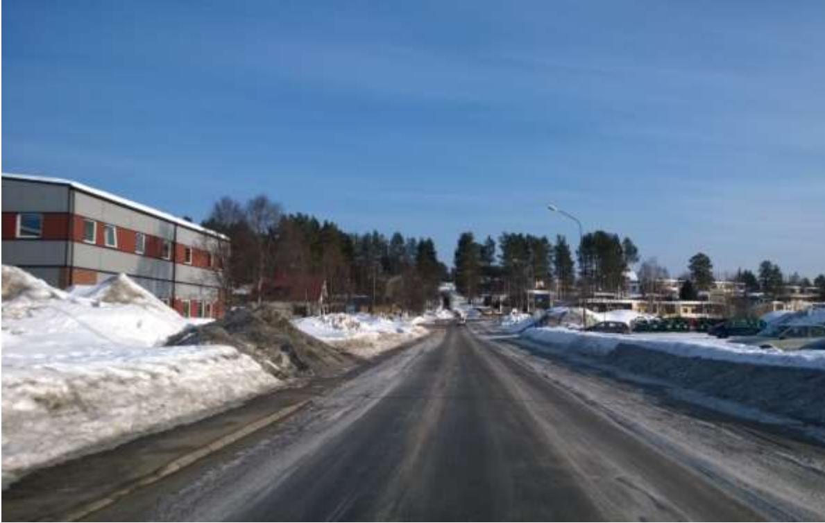
Figur 14. Hellebergsvägens befintliga utformning med kantstensbunden gc-väg på ömse sidor. Utsikt i nordlig riktning upp mot bostadsområdena vid Vallmovägen.

Tillfartsvägen till skolområdet föreslås efter planens genomförande enbart nyttjas för verksamheter för skolan samt is- och evenemangsarenan. Skolans behov omfattar kommunal skolskjuts och varustransporter till skolmatsalen. All annan biltransport föreslås ske inne på parkeringsytan.