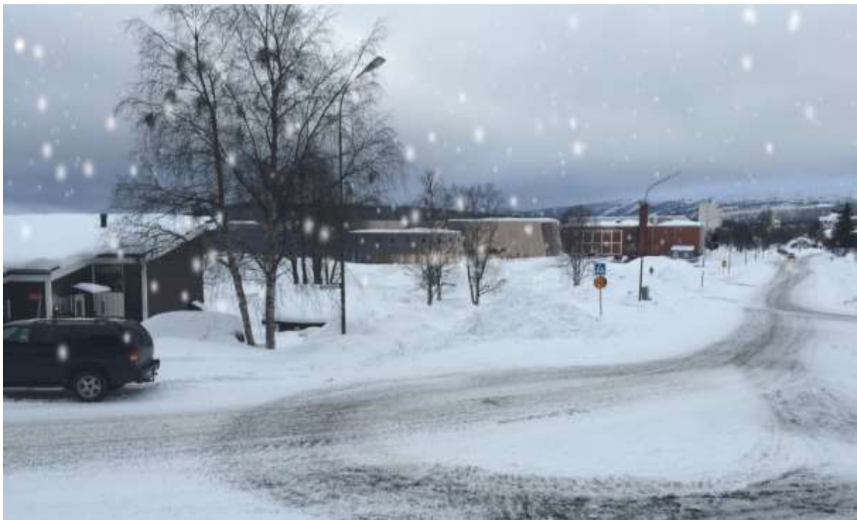
Figur 7. Fotomontage som redovisar hur den föreslagna is- och evenemangarenan upplevs i den befintliga stadsmiljön (MAF arkitektkontor AB).