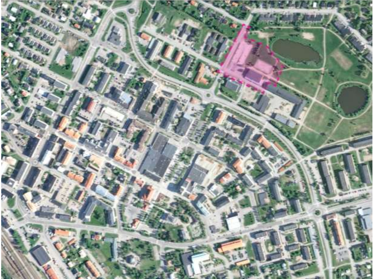
Figur 1. Planområdets ungefärliga omfattning illustreras med den rosa ytan.

Planområdet ligger i centrala Gällivare och gränsar till Sjöparksskolan och badhuset i söder, hotell och bostäder i norr och väster samt Sjöparken i öster.