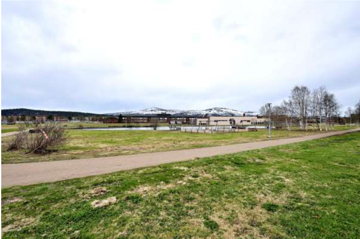
Figur 8. Fotomontage som visar påverkan av Isarenan i närheten vid fastigheten Skogsvaktaren 5.