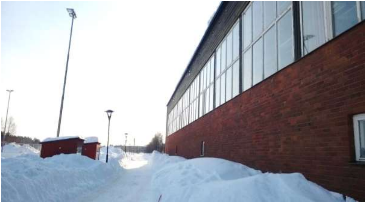
Figur 13. Sporthallens norra fasad som den nya is- och evenemangsarenan ska byggas ihop med.