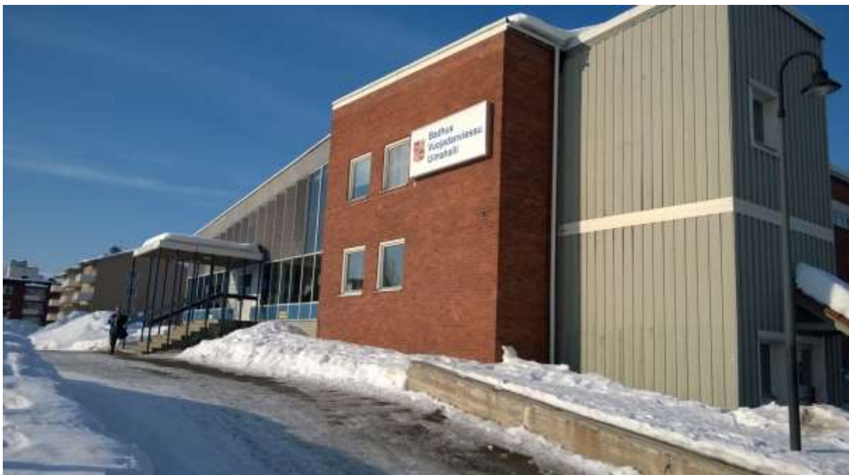
Figur 12. Badhuset i direkt närhet till planområdet.

Planförslaget innebär att tillkommande kommersiell service ges förutsättningar att skapas i Gällivare centrum. Is- och evenemangsarenan inrymmer ytor för restaurangverksamhet för 120 sittande gäster. Detta möjliggörs inom den föreslagna användningen av kvartersmark för idrotts-/evenemangsarena ( R 1 ). Den norra entrén till arenan bör användas till restaurangbesök. I detaljplanen möjliggörs en uteservering i anslutning till restaurangen som vetter mot Sjöparken.