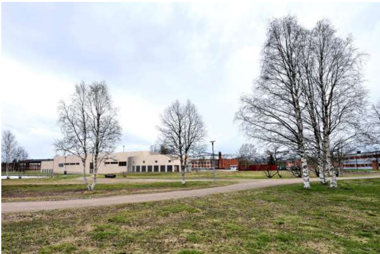
Figur 9. Fotomontage som visar påverkan av isarenan i närheten av fastigheten Rättaren 3, cirka 65 meter norr om den föreslagna arenan.