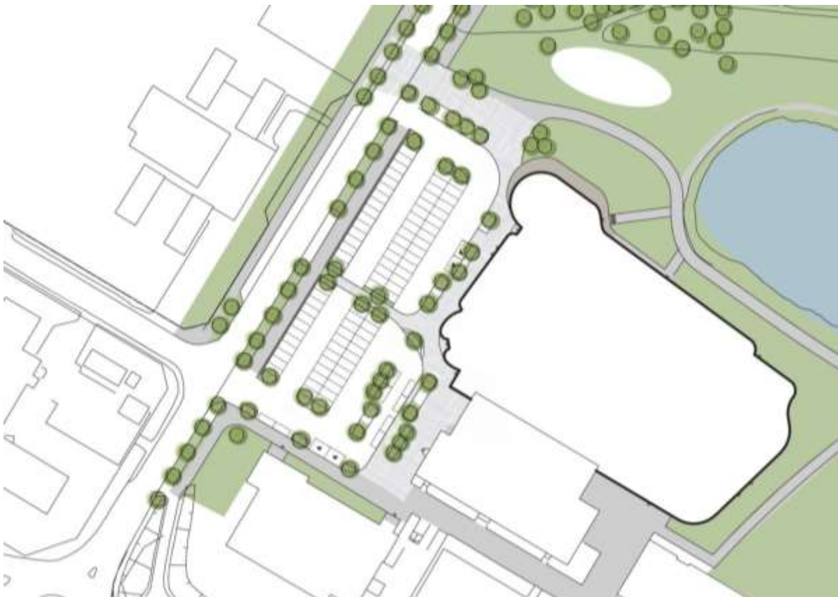
Figur 11. Illustrationskarta över parkeringen och utemiljön vid arenan.

Parkering till is- och evenemangsarenan regleras i detaljplanen till användning av kvartersmark parkering ( P ). För att säkerställa att inte parkeringshus tillåts regleras prickmark inom P. Antalet parkeringsplatser planeras till 96 stycken varav 4 stycken är parkering för personer med nedsatt rörelse- och orienteringsförmåga. Parkeringssytan föreslås anordnas med 56 parkeringsplatser med motorvärmastolpar som ska kunna hyras av kommunen under dagtid. Under resterande tid under dygnet bör dessa vara tillgängliga för besökare till de övriga verksamheterna.