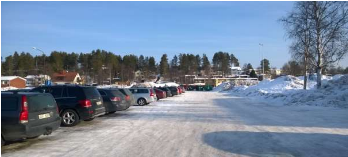
Figur 3. Planområdets mark och vegetation består till stor del av en asfalterad yta samt gräsvegetation.

Schaktning i marken kommer krävas för att möjliggöra byggnadens grundläggning. Se vidare under rubrik ”geotekniska förhållanden”.