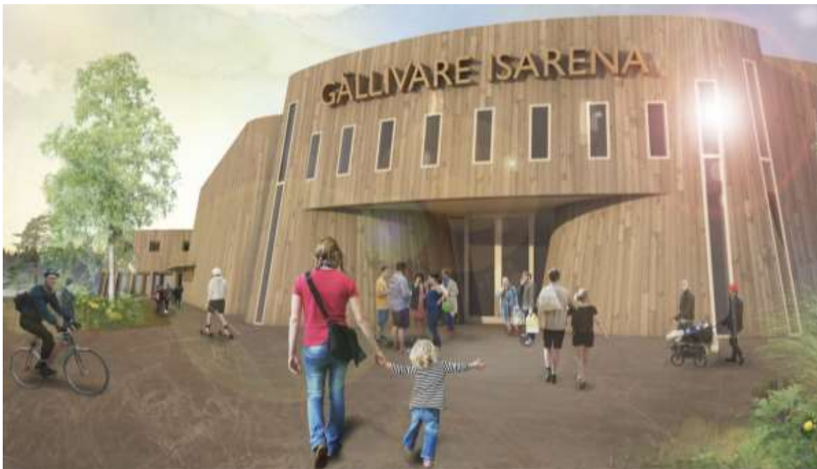
Figur 10. Illustration som visar en vision över den nya Is- och evenemangsarenan (MAF arkitektkontor AB).

Projektering av is- och evenemangsarenan pågår parallellt med planarbetet.