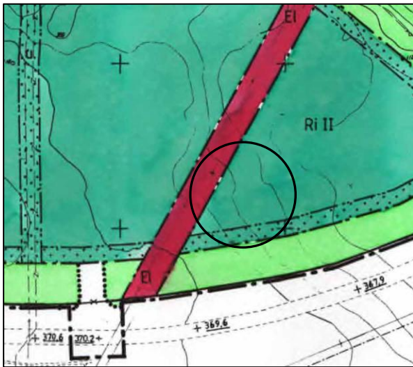
Gällande plan med det aktuella området inringat.

Den intilliggande transformatorstationen har beviljats bygglov 2014 06 04 av Miljö- och byggnämnden.