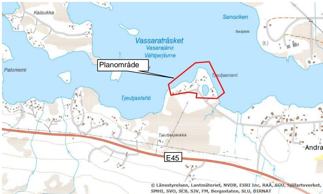
Figur 1. Översiktsbild över planområdet.