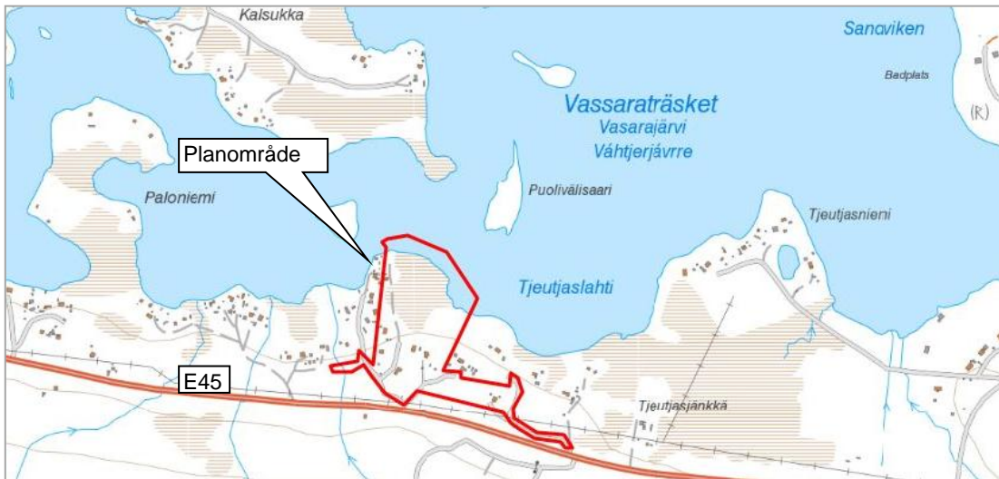
Figur 1. Översiktsbild över planområdet.