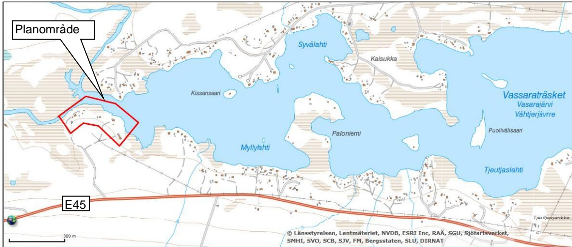
Figur 1. Översiktsbild över planområdet.