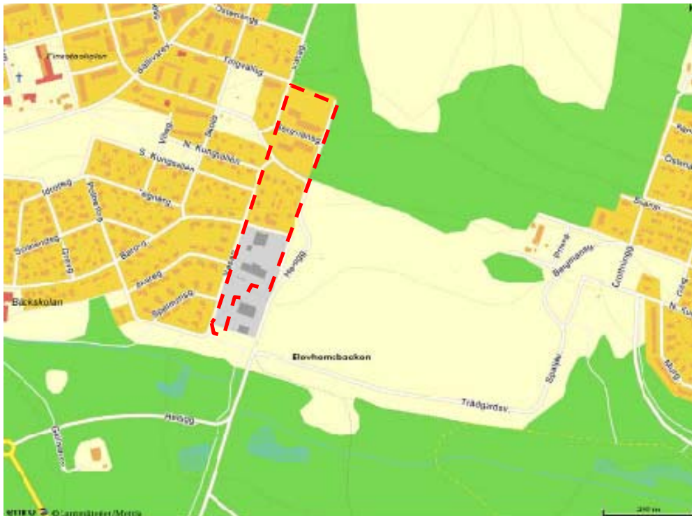
Figur 3. Karta som visar vägarna i området. Planområdet markerat med rött streck.