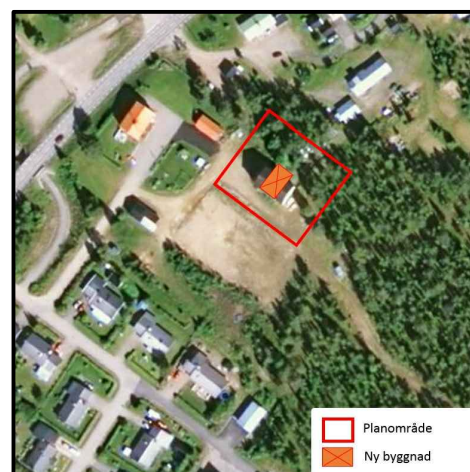
Skiss över planområdet