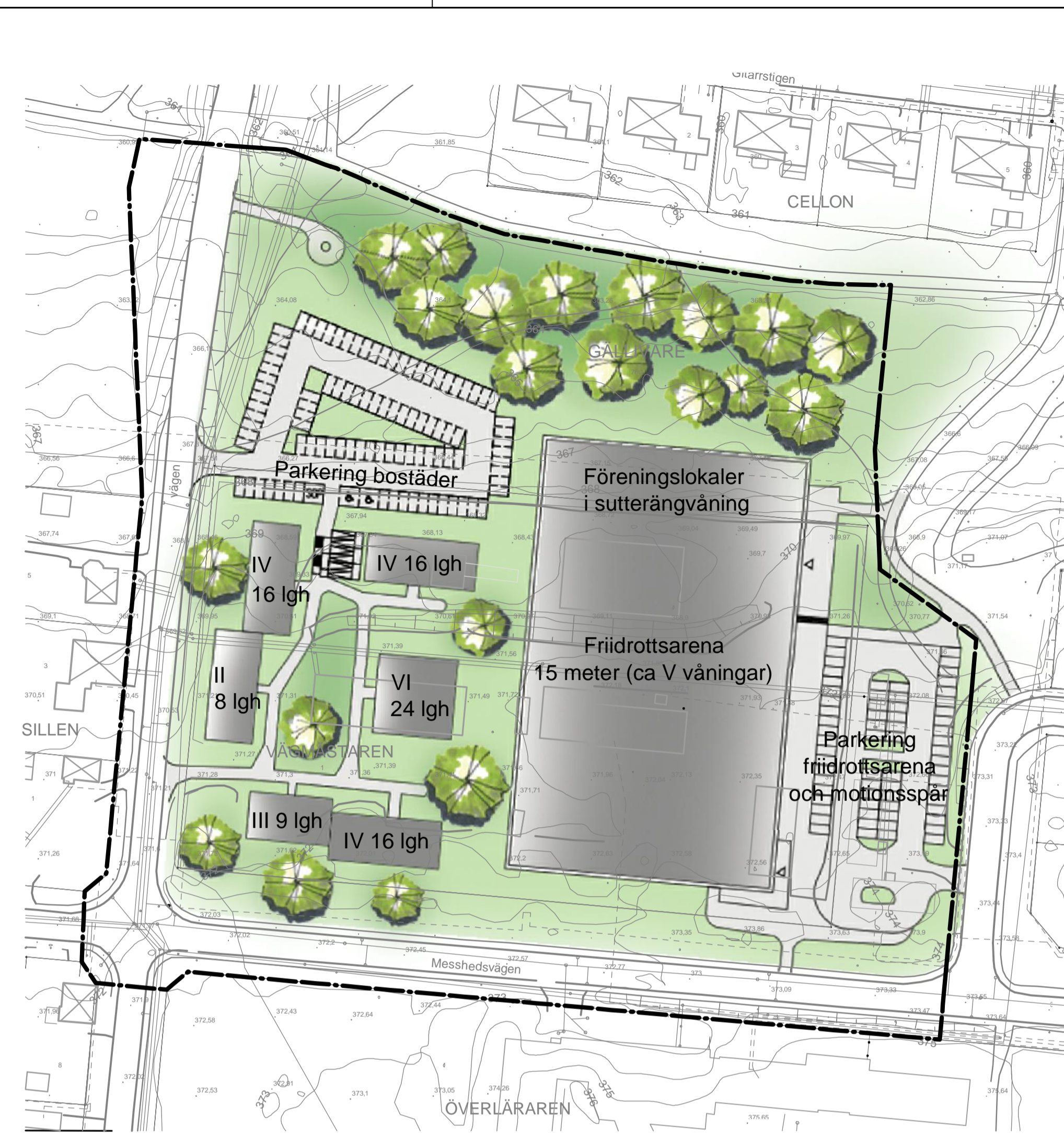
ILLUSTRATIONSKARTA- Förslag på utformning