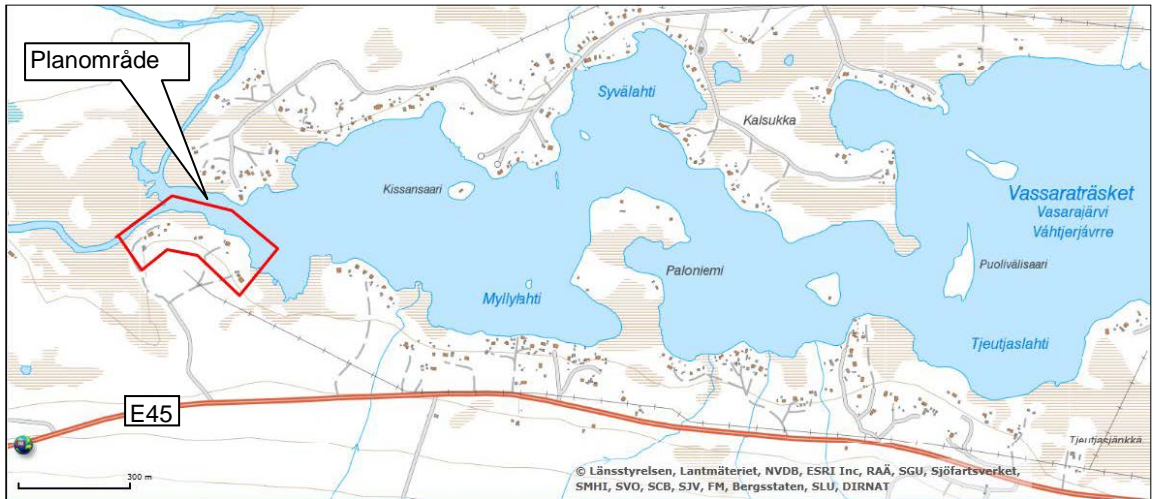
Figur 1. Översiktsskild över planområdet.