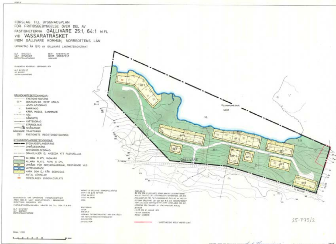
Figur 2. Plankartan till byggnadsplan akt 25- P 75/2