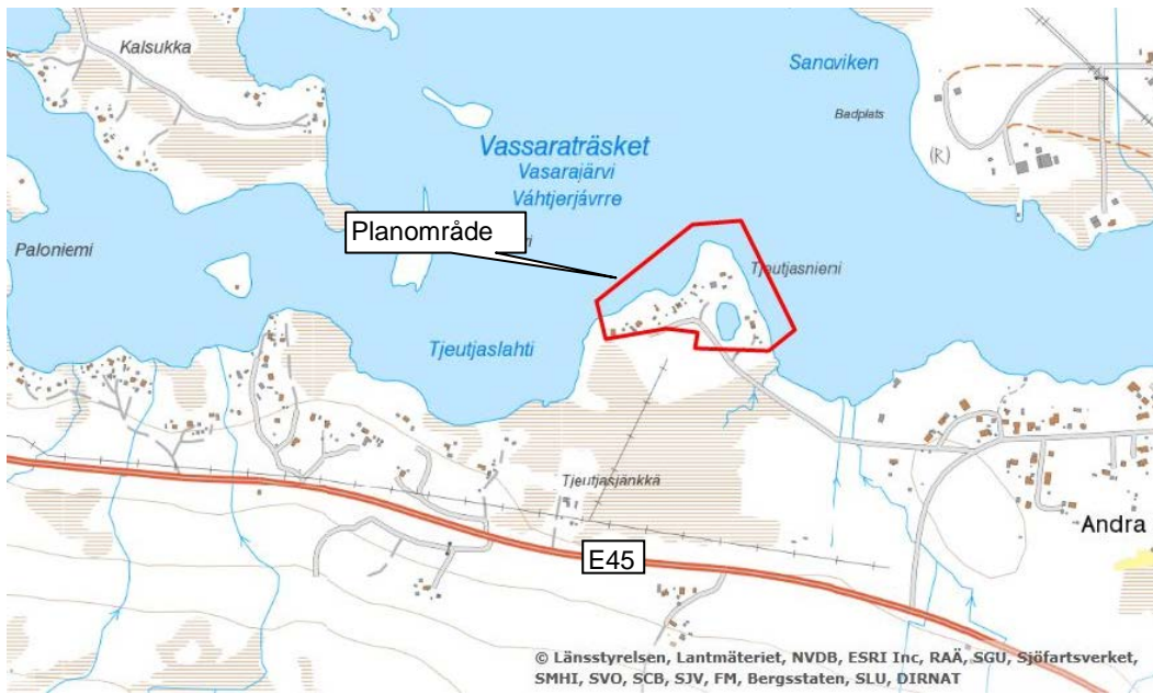
Figur 1. Översiktsbild över planområdet.