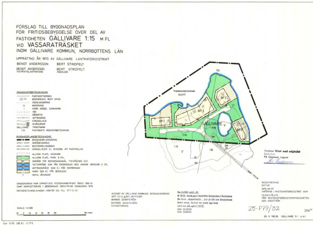
Figur 2. Plankartan till byggnadsplan akt 25- P 79/32