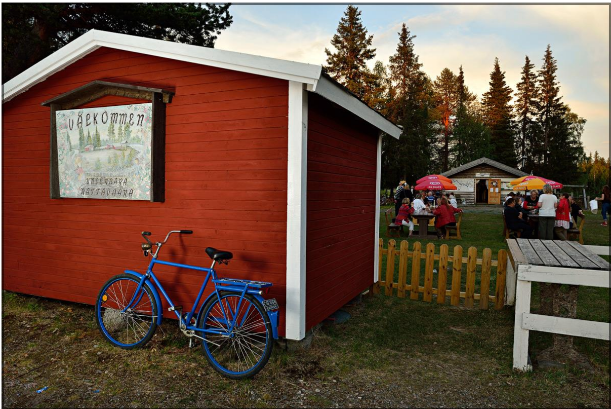
vid Bäckstranden i Nattavaara by.